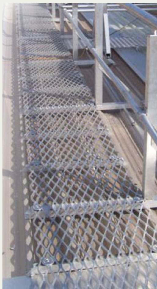
Aluminiumlaufsteg mit Handlauf